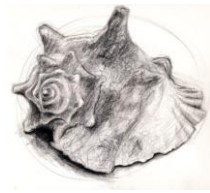
* Školjke *